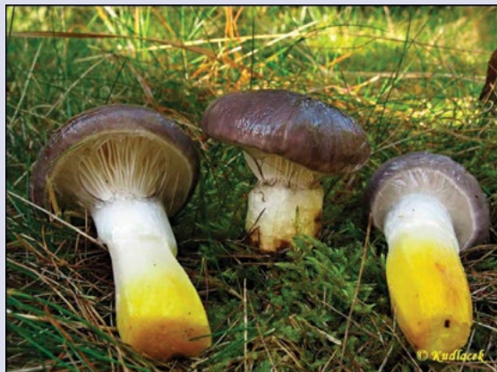
Marie Veselá Foto: Slizák mazlavý.

Na sklonku podzimu ubývají hříbovité houby, za to rostou typicky podzimní. Hlavně různé druhy čirůvek, pařezové houby jako třeba václavky, ve smrčinách ryzce, třepenitka maková, liška nálevkovitá. Ty patří mezi houbové otužilce. Znáte třeba slizák mazlavý? Nehezke jméno a vzhled, ale výborná chuť. Málokdo ho sbírá, ačkoliv se jedná o vynikající houbu připomínající klouzek, je nezaměnitelný. Má slizký klobouk nafialovělé barvy a ve spodní části třeně je žlutý. Roste od konce léta do listopadu v jehličnatých a smíšených lesích. Slizkou slupku z klobouku můžete jedním tahem sloupnout už v lese. Je výtečný ve směsích, výborný do polévek i v kyselých nálevech. Jeho jemně kyselou chuť doporučuji třeba do kulajdy.