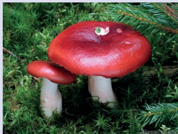
Foto: Holubinka nazelenalá, Holubinka vrhavka.